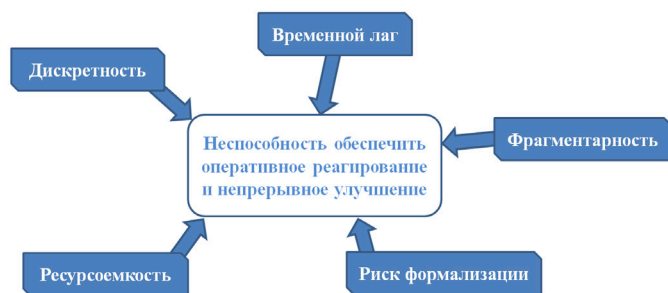
Рис. 1. Ограничения классической оценки СМК

Традиционные подходы к оценке эффективности СМК, основанные на периодических аудитах и анализе исторических данных, сталкиваются с системными ограничениями в условиях быстро меняющейся операционной среды. Основные ограничения приведены на рис. 1.