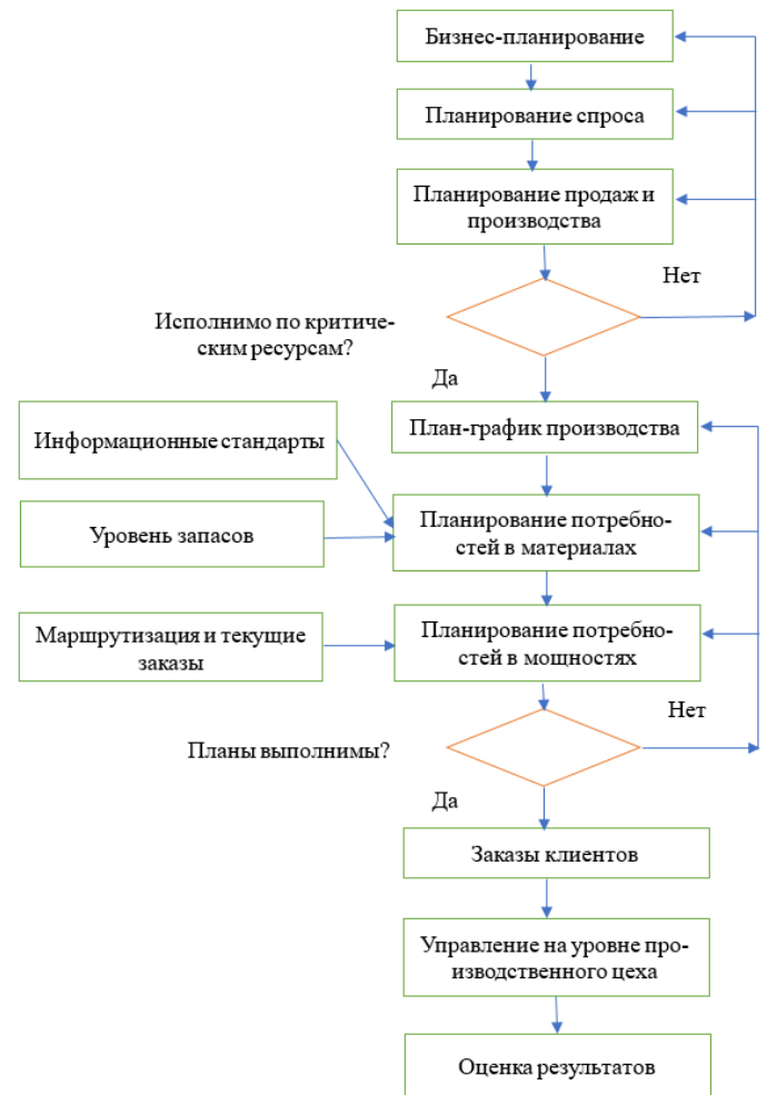
Рис. 2. Усовершенствованная методология информационного стандарта управления материальными и техническими ресурсами нефтегазового производства

Методология MRP II ориентирована на оптимальное управление материальными и техническими ресурсами нефтегазового производства при помощи прогнозирования ресурсов, бизнес-планирования и регулирования стадий нефтегазового производства. В целом, методология MRP II может обеспечить эффективное и своевременное решение задач, связанных с бизнес-планированием, планированием нефтегазового производства, потребительского спроса, объема продаж. Это совокупность практик, принципов, управленческих процедур, практическое осуществление которых приводит к совершенствованию ин-