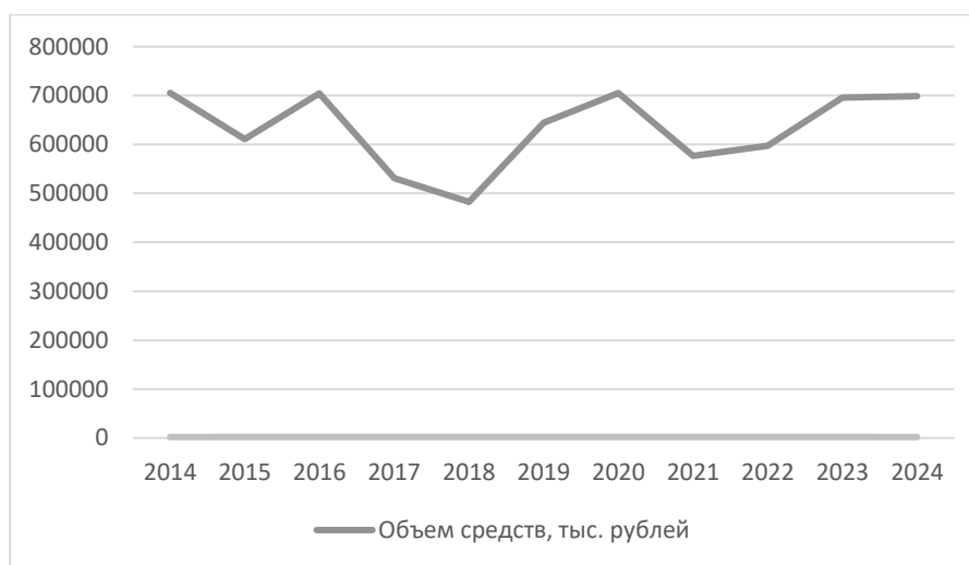
Рис. 2. Объем бюджетного финансирования госпрограммы РФ «Развитие промышленности и повышение ее конкурентоспособности» на реализацию программы национальной стандартизации в 2014–2024 гг. [1–11]

Более того, по данным из принятых Государственной Думой Российской Федерации федеральных законов об утверждении результатов исполнения федеральных бюджетов на 2014–2024 годы, объем бюджетных средств на реализацию программы национальной стандартизации в рамках госпрограммы РФ «Развитие промышленности и повышение ее конкурентоспособности» не поднимался выше 710 млн рублей в годы высокой степени влияния кризисных явлений в экономике, при этом нижняя точка графика (рис. 2) соответствует 482,5 млн рублей в 2018 году в условиях влияния санкций против российской экономики.