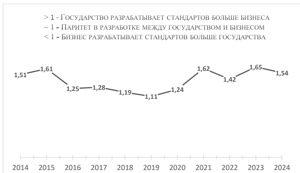
Рис. 3. Динамика отношения разработанных стандартов между рыночным и государственным режимами мультимодальной национальной стандартизации в 2014–2024 гг.

Динамика отношения разработанных стандартов частными и государственными разработчиками представлена на рис. 3.