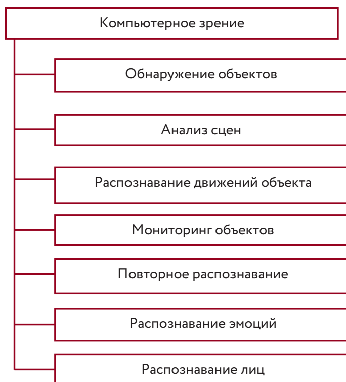
Рис. 1. Перспективные направления исследований в области КЗ

Природная физиологическая сложность зрительного процесса человека приводит к значительным трудностям его моделирования и технологической реализации на практике. Поэтому в настоящее время полноценной СКЗ эквивалентной полному функционалу человеческого зрения не создано. В процессе многолетних и многочисленных наработок в данной области сформировались общие отдельные перспективные направления исследований, представленные на рис. 1 [2].