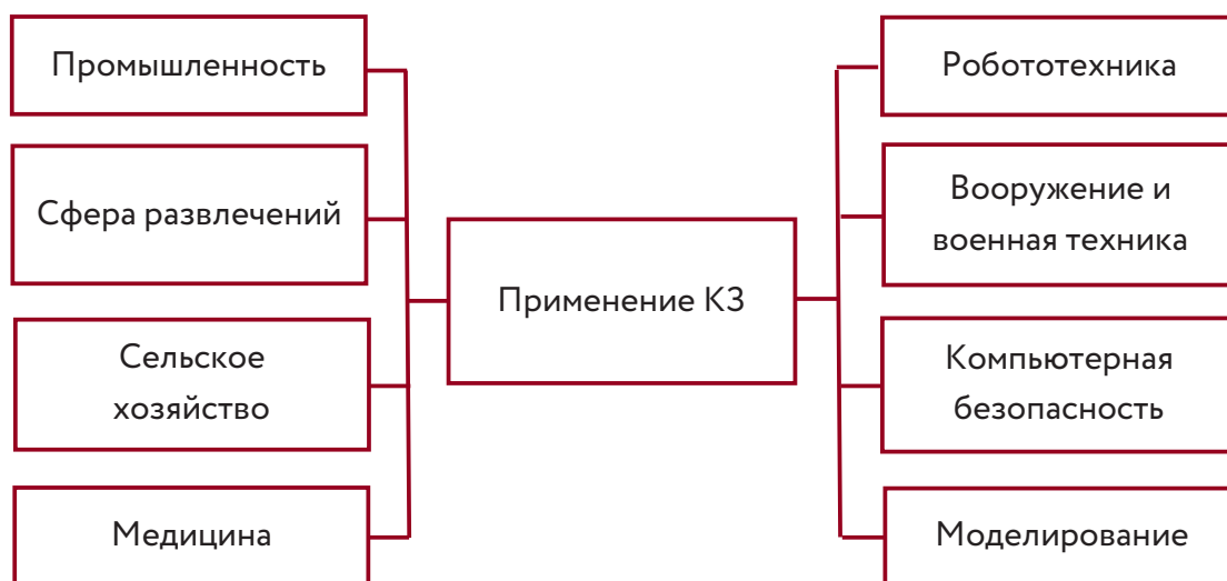
Рис. 3. Основные сферы применения КЗ

Представленная модульная структура ТКЗ носит условный характер. На практике, в зависимости от поставленных целей и сферы применения КЗ, некоторые ее этапы могут быть объединены или отсутствовать.