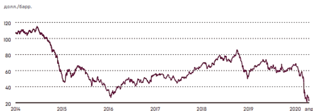
Рисунок 2. Статистика цен на нефть марки brent за 2014-2020 гг [9].

Развитие малого бизнеса в России тоже отстает. Предприниматели сталкиваются со многими препятствиями: несовершенные законы, регулирующие деятельность предприятия, сложность получения кредита в банке из-за низкого уровня доверия кредиторов, трудности в привлечении квалифицированных сотрудников. Коррупция также является серьезной проблемой в экономике России. Конечно, в стране ведется активная борьба против взяточничества, однако полностью устранить эту проблему не получается. Таким образом, в последние годы российская экономика переживает тяжелые времена. Происходит сильное политическое и экономическое давление со стороны Западных государств. Установление против России санкций потребовало больших издержек на поиск новых